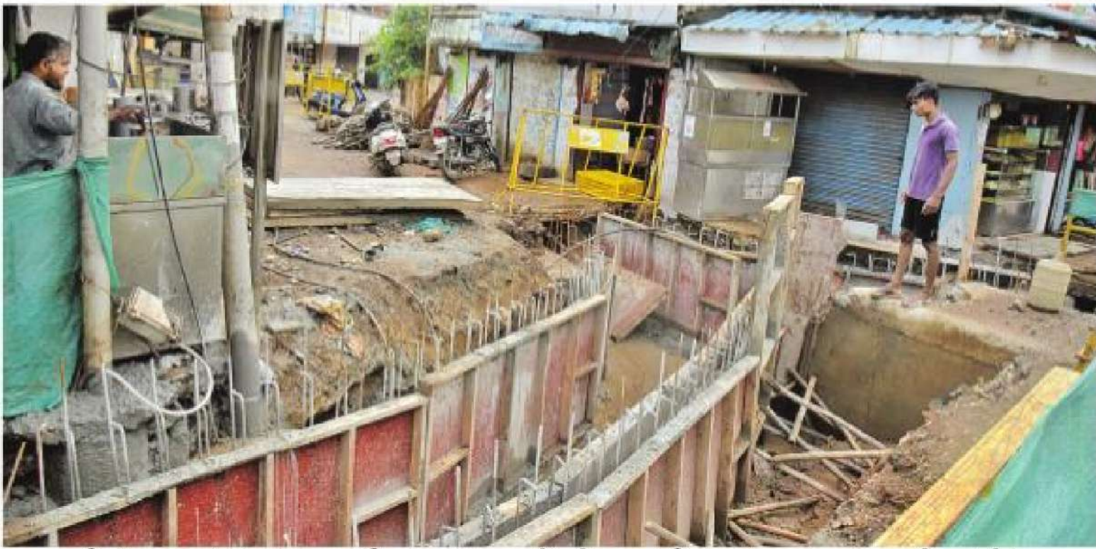
சென்னை அம்பத்தூர் பழைய இஸ்லாமிய சாலை, ரயில் நிலையம் செல்லும் பஜார் சாலை ஆகியவற்றில் மந்த கதியில் நடைபெறும் மழைநீர் வடிகால் பணிகள்; இதனால் குடியிருப்புகள் திறந்துள்ள இந்தப் பகுதியில் வசிக்கும் பொது மக்கள் நாள்தோறும் மிகுந்த சிரமத்துக்குள்ளாகின்றனர்.